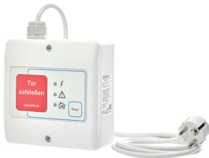
Abb. 3: FSZ Pro 230 V