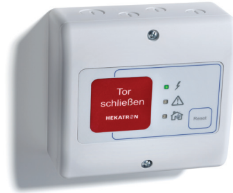
Abb. 1: FSZ Pro

Für eine Pufferung muss im FSZ Pro ein Energiespeichermodul ESM Pro verbaut werden. Das ESM Pro ist als Zubehör erhältlich.