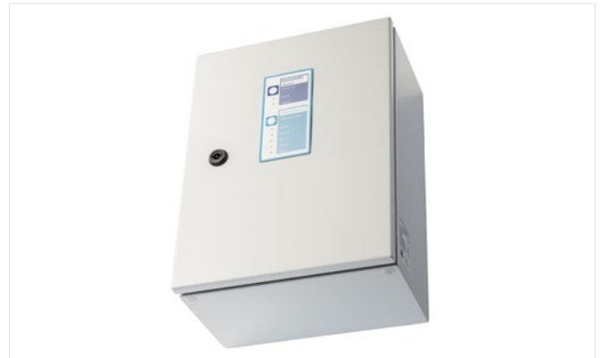
Abb. 1: SVG 522/TSK 03