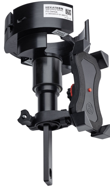
Abb. 1: Prüfgerät Genius mit Smartphone-Halterung (Abbildung ähnlich)