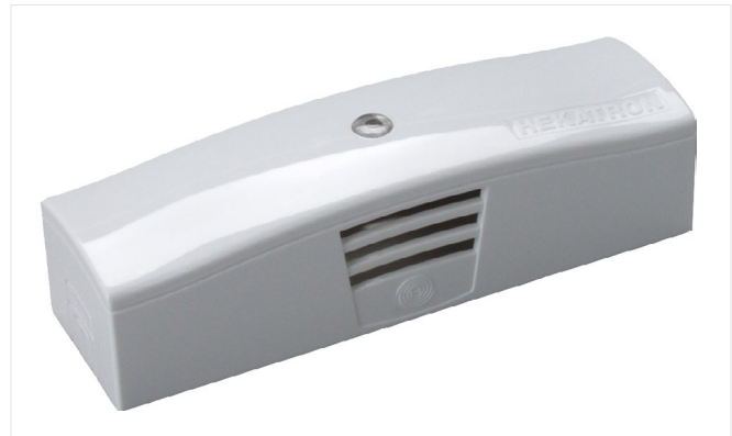
Abb. 1: FSZ Kompakt

Ein Eingang zum Anschluss der Brandmelder und eines Handauslösetasters im 1-Stichbetrieb. Ein Eingang zum Anschluss eines Resettasters.